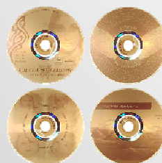
Imprimer la surface LightScribe

Retourner le disque dans la station Allwena Papyrus